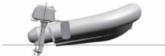
L'avant du bateau déjàuge, trop de trim positif